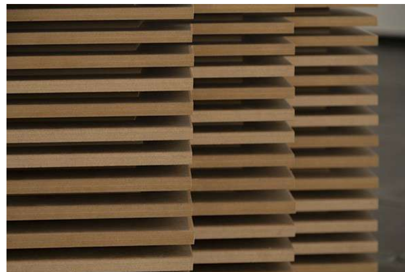
RLX (Torres de Playamar). Detalle, 2021. Técnica mixta Galería Isabel Hurley, Málaga

Montesinos, con algunos de sus dispositivos de exposición , consigue evidenciar el profundo carácter plástico que posee la arquitectura ligada al Estilo del relax, lo que la convierte en en proto-postmoderna , pues parte de ella encarna, desde los años cincuenta, valores hápticos, esculturales, plásticos y cierta reformulación de lo vernáculo que vendrían a ser descritos como rasgos esenciales de la venidera arquitectura post-moderna. Resulta clave el comentado acto de descomponer esos edificios en sus materiales y elementos esenciales, en mostrarnos el vocabulario que se articula en lenguaje o estilo, en destacar sus significantes. Sus obras, por mor de esto, pasan a ser ejercicios de metonimia. Es decir, algunos de esos fragmentos nombran irrevocablemente al edificio que los ampara.