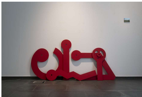
RLX (Mare Nostrum) , 2021. Técnica mixta Galería Isabel Hurley, Málaga