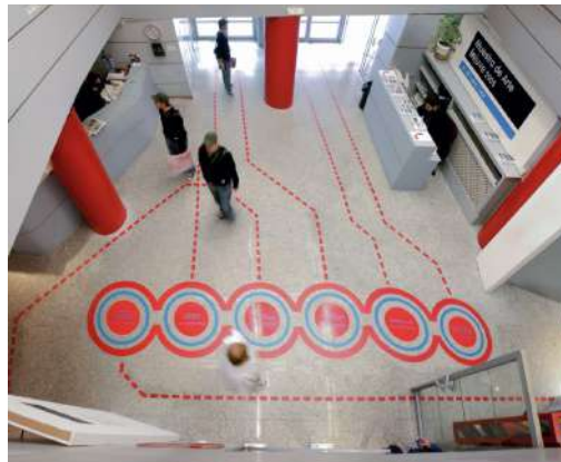
Antes que nada , 2005. Vinilo y cinta americana INJUVE, Sala Amadís, Madrid