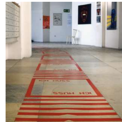
ICH , 2003. Cinta americana Jahreausstellung. Akademie der Bildenen Künste MünIch (DE)