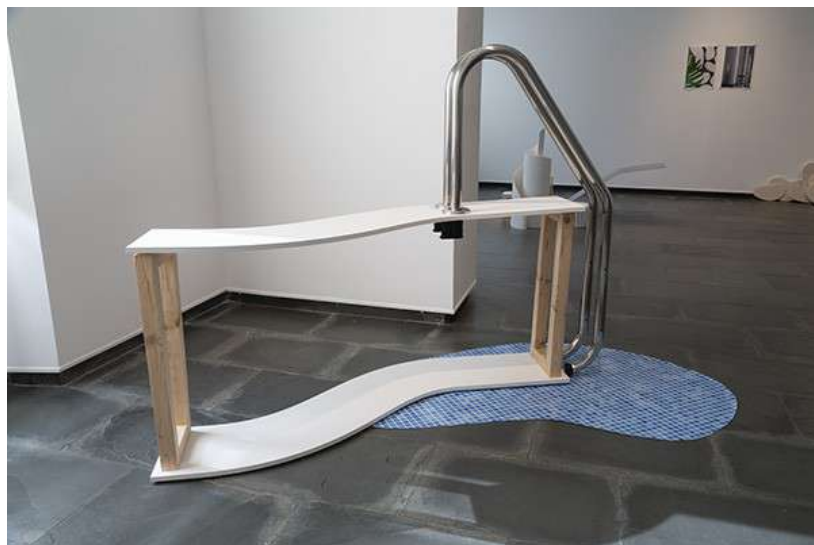
RLX (Apartamentos San Miguel), 2021. Técnica mixta Galería Isabel Hurley, Málaga