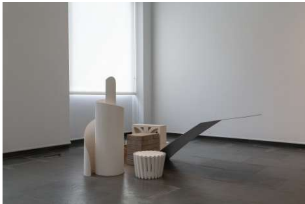
RLX (Residencia Tiempo Libre) , 2021 Galería Isabel Hurley, Málaga